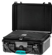
* interior bag