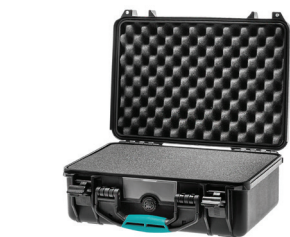
* cubed foam